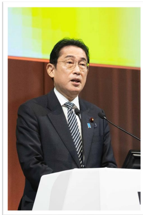
↑ 勝利への飛躍を誓う岸田総裁 ← 岸田総裁を先頭にガンバローコール ※令和5年3月7日発行自由民主第3018号より転載