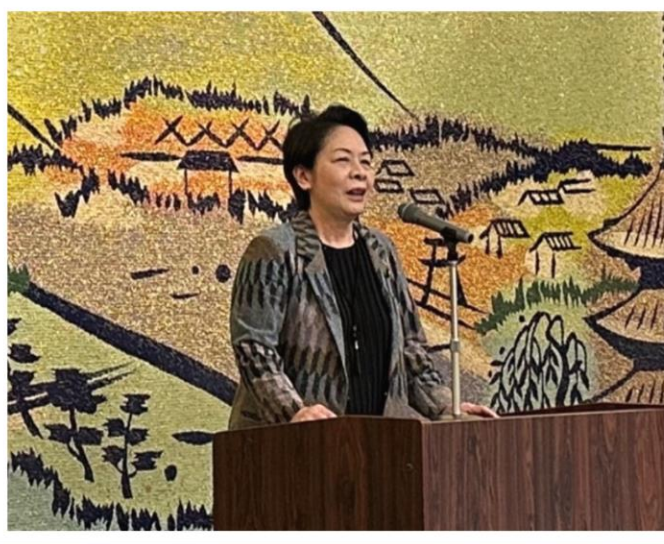
香川県デンタルミーティングにて